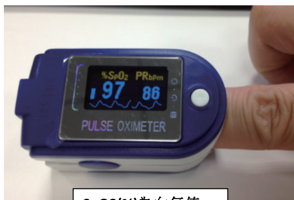
SpO2(%)為血氧值 HR or PR 為心跳值